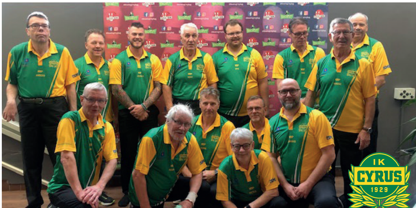
IK Cyrus bowlingherrar har inlett säsongen bra.

Höstens seriespel har löpt på bra för IK Cyrus A-herrar och placerar sig på en 2:a plats i sin Div.3 grupp. Med 7 segrar i bagaget så får vi se det som en klar framgång. Det känns skönt och inspirerande att starta upp vårsäsongen och vara med där i toppen för ett ev. avancemang. Detta trots att spelare har varit skadade och borta av olika anledningar. B-mannarna som vi spelar ihop med Jönköpings BK har också gjort en bra höst, 6 segrar, 1 oavgjord och 3 förluster gör att laget placerar sig på en fin 3:e plats när höstsäsongen är spelad. Bra jobbat!