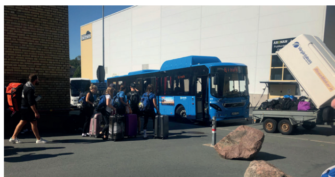
En av många välfyllda bussar efter avslutat läger.