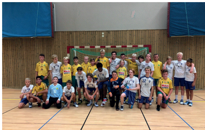
Cyrus/Bankeryds P05:or mötte Baltichov i en bra match.