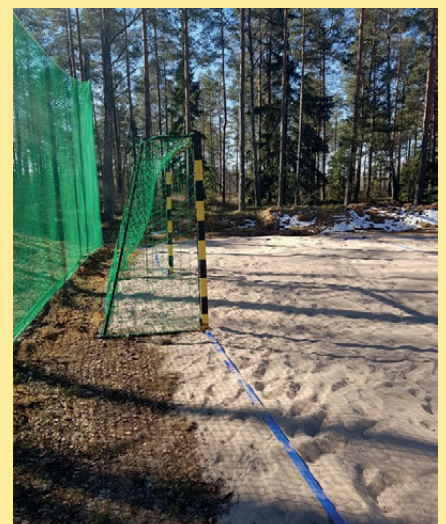
Beachhandbollsplanen i våras.

Varje måndag året runt samlas ett troget gäng veteraner i Cyrusstugan – en klenod och ett arv värd att vårda och förvalta för kommande generationer.