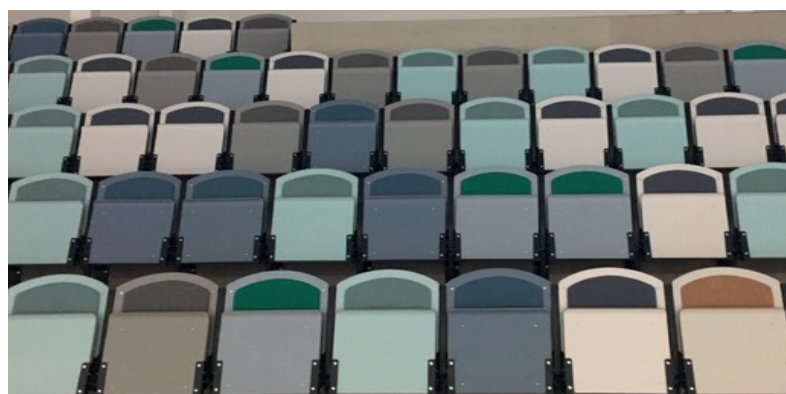
Stolarna går i grått, grönt, blått och beige nyanser.