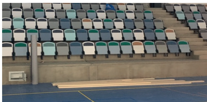
I november tror kommunen att hallen kan tas i användning.