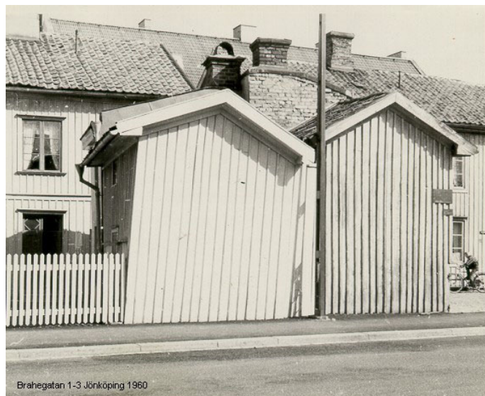
Det var här promenaden startade mot Sandseryds kyrka